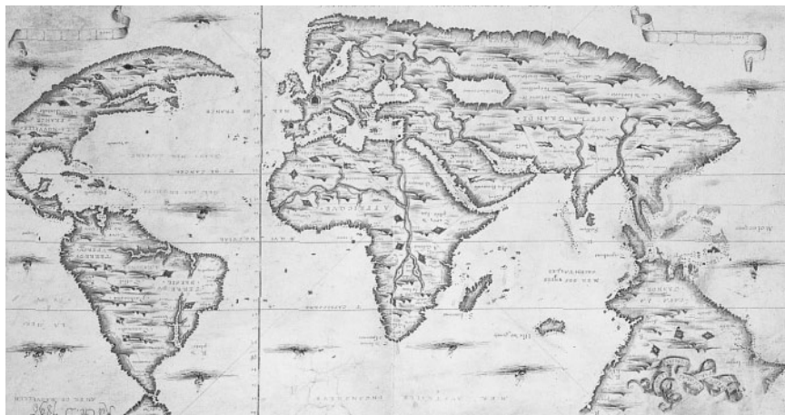
Planisferi de Desliens de 1566.