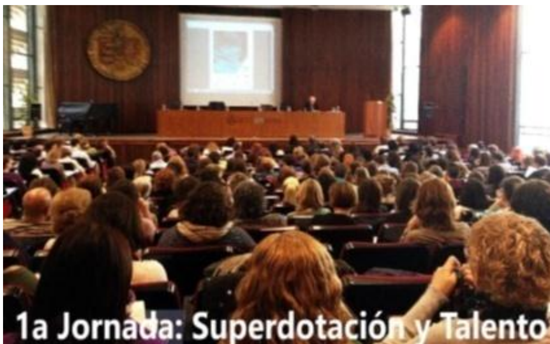
Organizada por el Instituto Valenciano de Altas Capacidades. Aula Magna de la Facultad de Ciencias de la Educación de la Universidad de Valencia, 25 de enero de 2014

Con frecuencia, funcionarios del asesoramiento psicopedagógico de las escuelas o de orientación de los institutos de secundaria, siguen realizando el diagnóstico, le llaman "evaluación psicopedagógica" y niegan a los padres el informe con los resultados aduciendo que se trata de "información confidencial e interna". Los padres, en el desconocimiento de las pruebas que han efectuado a su hijo, y de sus derechos básicos, no pueden, por tanto, encargar un diagnóstico en un centro especializado hasta haber transcurridos dos años, ya que para la validez de las pruebas un niño no puede realizar una misma prueba hasta que no hayan transcurrido dos años. El Defensor del Estudiante en su web http://www.defensorestudiante.org/ ha tenido que habilitar el espacio: http://defensorestudiante.org/de/archivos/pdf/derecho_escolar.pdf para ayudar a los padres en la defensa de sus elementales derechos, con la colaboración de la Agencia Española de Protección de Datos, y crear una alerta para todos los padres. http://defensorestudiante.org/de/archivos/pdf/ALERTA_A_TODOS_LOS_PADRES.pdf