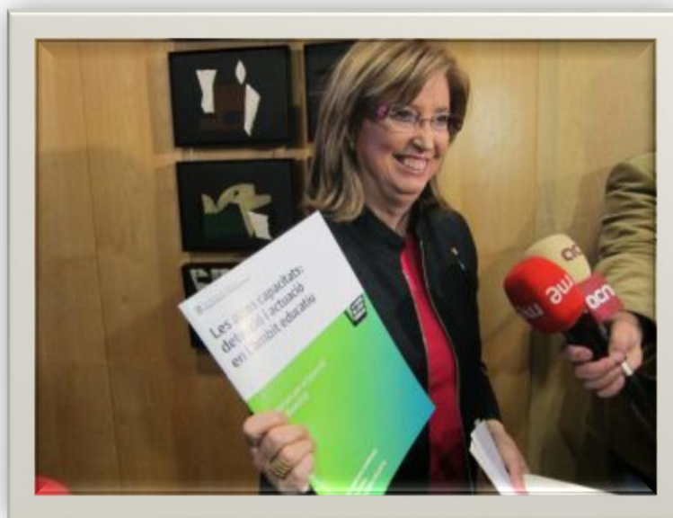
La Consejera de Educación (d'Ensenyament) de la Generalitat de Catalunya Irene Rigau, en el acto de presentación de su “guía” a los medios de comunicación

(Más información en el Capítulo VII: “La educación en nuestras leyes y en nuestra Jurisprudencia. El Derecho a la Educación en Libertad”, pág. 68, y en el Capítulo XI, “El Defensor del Estudiante”, pág. 99 - 105).