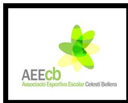
FOTO GENERAL DE L'AE ECB