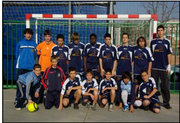
FUTBOL SALA INFANTIL