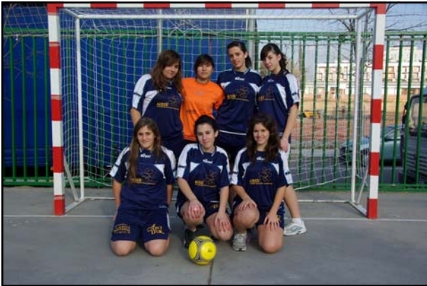
FUTBOL SALA FEMENÍ