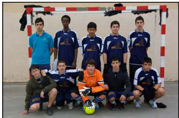
FUTBOL SALA CADET